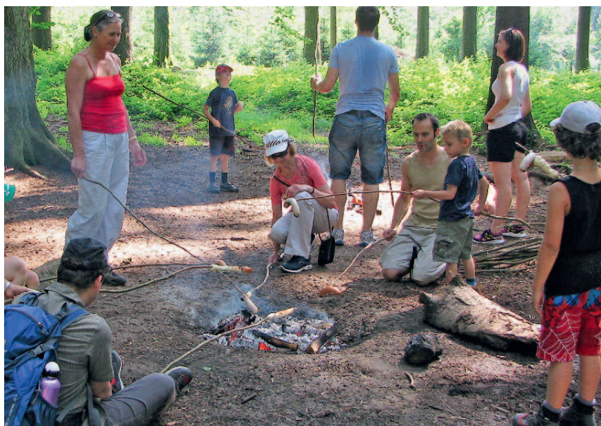
Feuermachen im Wald erfordert Aufmerksamkeit

In diesem Jahr hat es in Schweizer Wäldern bereits etliche Male gebrannt. Das schöne Wetter und die Trockenheit haben viele Menschen ins Freie gelockt, aber auch die Waldbrandgefahr erhöht. Bei dürrerem Gras und trockenen Stauden braucht es nicht viel, dass sich ein Feuer ausbreitet. Kommt Wind dazu, geht es umso schneller. Gemäss Bundesamt für Umwelt gab es in den letzten zwanzig Jahren durchschnittlich 90 Brände pro Jahr, dabei wurden jährlich um die 370 Hektaren Wald verwüstet, also jährlich mehr als unser gesamter Korporationswald. Das müsste nicht sein. Die meisten Waldbrände sind auf menschliche Ursachen zurückzuführen.